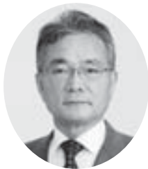
東根市商工会会長