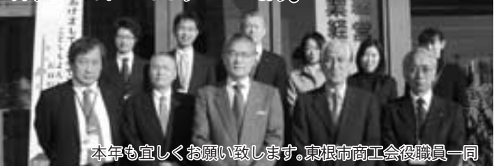
本年も宜しくお願い致します。東根市商工会役員一同