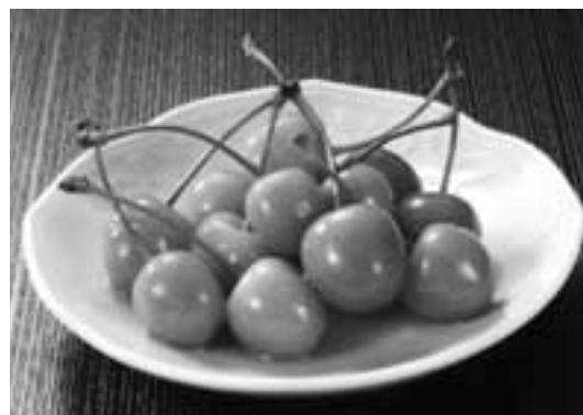
東根市で地域資源第1号となった陶壽屋漬物道場の「さくらんぼ漬け（試作品）」