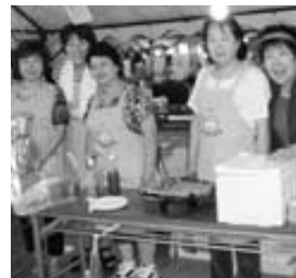
ひがしね城下町夏まつり

◆花いっぱい運動、地域のこどもみもり隊(奉仕活動)、視察研修、湯けむり映画祭協力、臨時売店出店(ひがしね城下町夏まつり、ひがしね祭り)、慰問事業(第一白水荘)、部員研修(陶芸教室等)、新春講演会、環境改善促進事業(マイバック推進等)